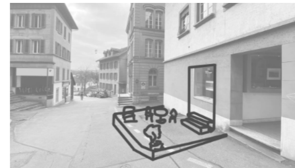
Das Wohnen im Erdgeschoss ist an gewissen Stellen ein valabler Ersatz für ausgezogene Läden. Die Stadt ist gefordert, diese Nutzung an ausgewählten Lagen zuzulassen und die Aussenräume nutzbar zu machen.

TIPP-> Kontaktieren Sie Christoph Muralto von der Finanzdirektion, um Ihnen ein Angebot machen zu lassen.