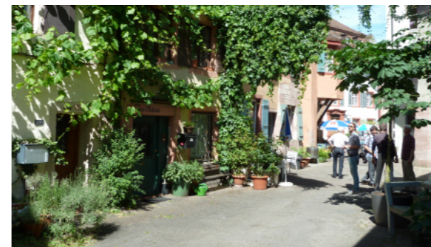
Die Begrünung der Gasse und der Fassaden tut der Wohnqualität gut. Auch die Rütchelengasse würde einladender aussehen mit Pflanzen. Im Bild: Rheinfeld AG.