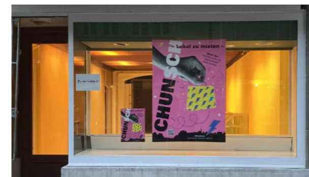
Die Freunde der Altstadt unterhalten eine Webseite mit aktuellen Angeboten zu Ladenflächen. Sie bespielen leerstehende Räume mit ihrer Plakataktion «chunsch» und machen so auf die bestehenden Potentiale aufmerksam.