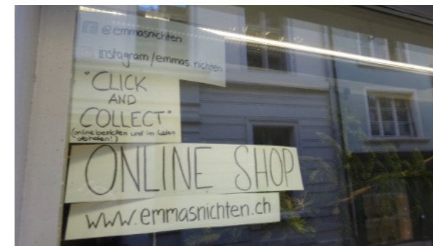
Das Nachnutzen von ehemaligen Laden- und Gewerbeflächen ist nicht einfach. Die Erträge sind bescheiden (in der Regel um 100.-/m 2 ). Trotzdem macht es Sinn, jungen Nutzungen mit einem günstigen Angebot einen Start in der Altstadt zu erleichtern.