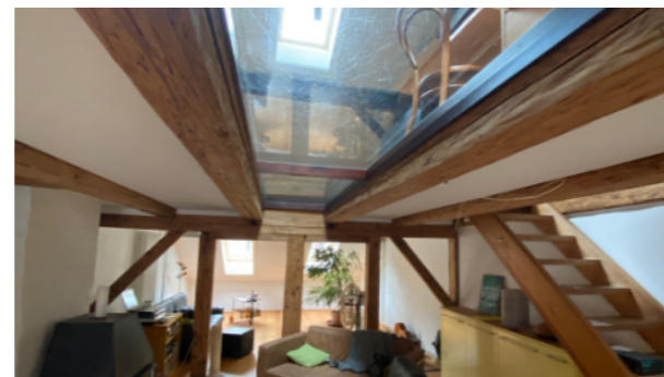
Auch in der Altstadt sind innovative Wohnlösungen möglich, zum Beispiel, um Licht in die Wohnungen zu holen. Die Denkmalpflege darf gefordert werden, wenn es um Spielräume und Ideen geht. Das Beispiel zeigt eine Lösung an der Rüttschelengasse.

TIPP-> Wählen Sie ein Architekturbüro mit Erfahrung im Altbau und funktionierenden Kontakten in die Denkmalpflege. Besuchen Sie bestehende Lösungen in der Altstadt, um sich inspirieren zu lassen.