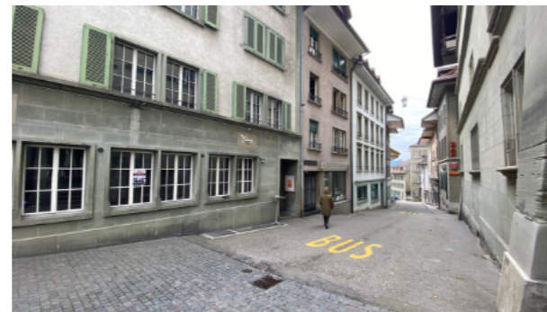
Die Rüttschelengasse ist noch immer das «hässliche Entlein» der Oberstadt. Das muss nicht so bleiben. Sie hat Potentiale, die in den nächsten Jahren genutzt werden sollen. Dieses Faltblatt zeigt Wege.

TIPP-> Schaffen Sie Aussenraum als Gegenstück zu den eher düsteren Wohnungen. Sowohl die rückliegenden Gärten wie auch dereinst die Gasse stellen dazu ein Potential dar.