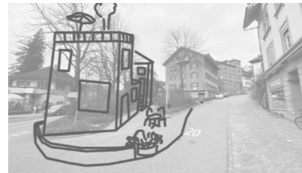
Ein Weiterbauen an unseren Altstädten ist möglich, zumal das immer so gehandhabt wurde. Dabei sind massvolle Baukörper wichtig, die sich gut einfügen und einen Mehrwert für die Gasse bringen. (Skizze: Paul Hasler, EspaceSuisse)

TIPP-> Sorgen Sie in ihrem Haus für einen stimmigen Mix. Bedenken Sie, dass lärmige und geruchsintensive EG-Nutzungen das Wohnen abwerten. Bevorzugen Sie weniger lukrative aber stimmigere Nutzungen im EG. Sichern Sie sich mit den günstigen EG-Mieten eine solide Miete im OG. Sprechen Sie sich mit den benachbarten Hauseigentümern ab.